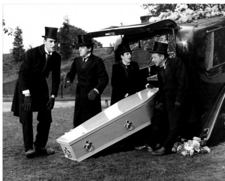
Les croque-morts de l'entreprise Patmoes en pleine action !

Les spectacles de fin de stage se dérouleront au Carré-Sévigné les jeudi et vendredi soirs.