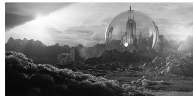
La planète Mars un soir de pleine lune

avec concerts et spectacles de fin de stage